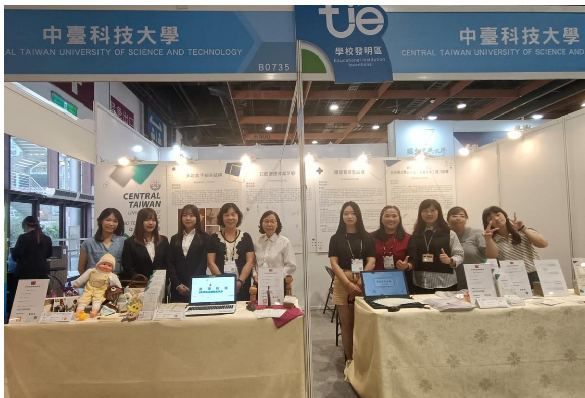
比賽情形 2: 與中臺科大參賽者合影